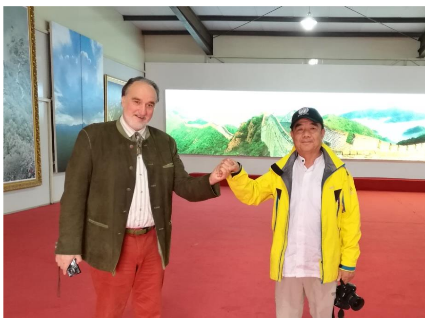
Fotograf Wielkiego Muru Chińskiego Gao Heping